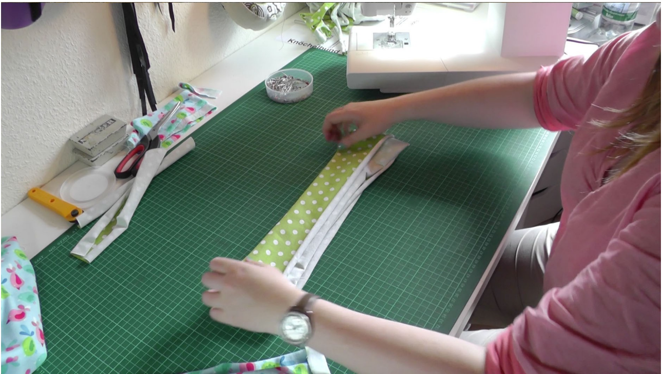
Hosendbund mittig nach innen falten und...