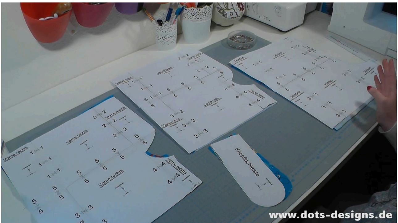
Schnittmuster auf Stoff übertragen. 1xVorne Links, 1xVorne Rechts, 1xKnopflochleiste und 2x Hinten.