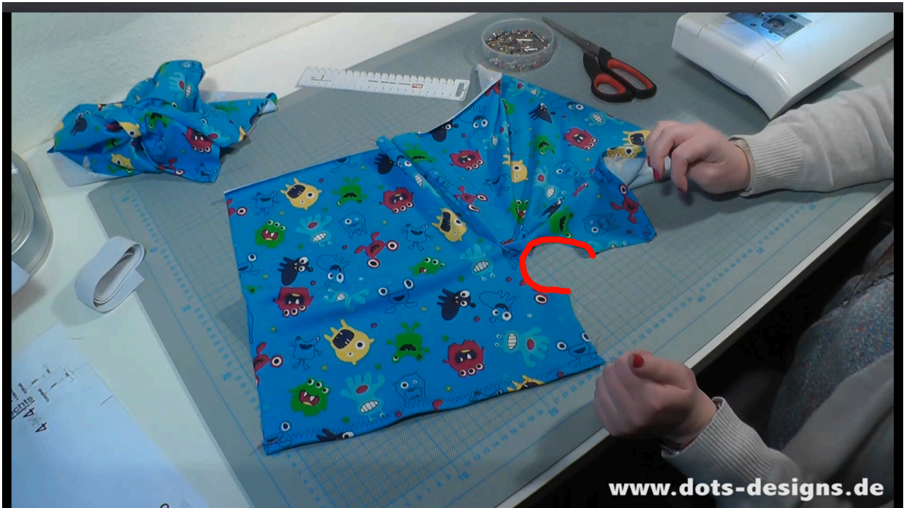
Hier wird der Stoff rechts auf rechts gelegt und an dieser Stelle fest genäht.