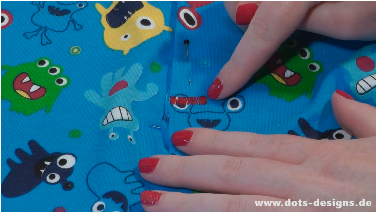
Hier wird ein Raupenstich von ca.2cm hingenäht.