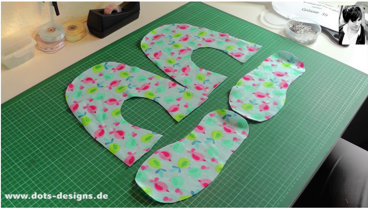
Das gleiche machst Du nochmal für die Aussenseite vom Schuh.